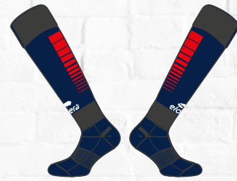
MODELE LAS PALMAS